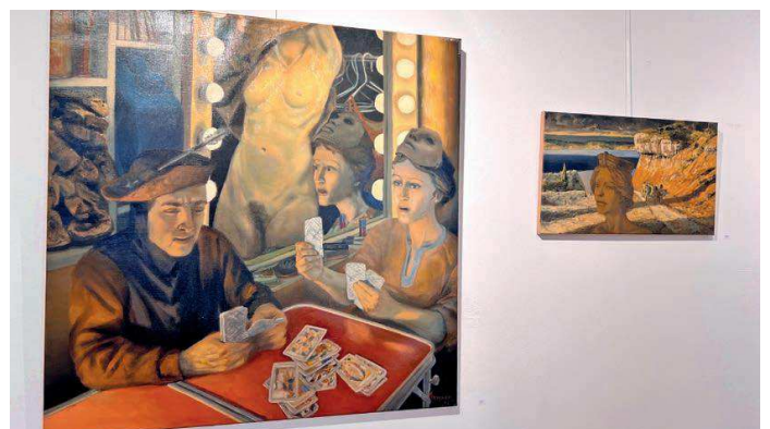
Une cinquantaine d'œuvres sont exposées dans les salles de la Galerie Zwahlen, dont Tarot en coulisses , avec la tricheuse qui porte le masque sur la tête, et une petite toile sur la Méditerranée.